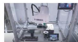
スカラロボットYK400XE × ビジョンシステムivY2 × Asycubeで生産性向上